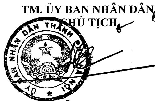
Nguyễn Đức Chung

Điều 18. Trong quá trình thực hiện Quy định này, nếu phát sinh khó khăn, vướng mắc, các cơ quan, đơn vị, cá nhân, tổ chức kịp thời phản ánh về Ủy ban nhân dân Thành phố (qua Văn phòng Ủy ban nhân dân Thành phố tổng hợp) để xem xét, giải quyết./.