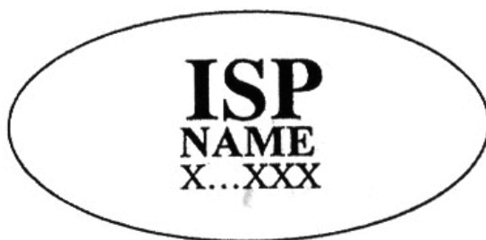
Hình 1 - Mẫu dấu chứng nhận hợp chuẩn sản phẩm mật mã dân sự

Mẫu dấu chứng nhận phù hợp tiêu chuẩn đối với sản phẩm mật mã dân sự được thiết kế dưới dạng hình Ellipse có đường kính ngang gấp đôi đường kính dọc.